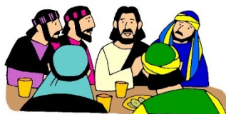
sy vriende en bure